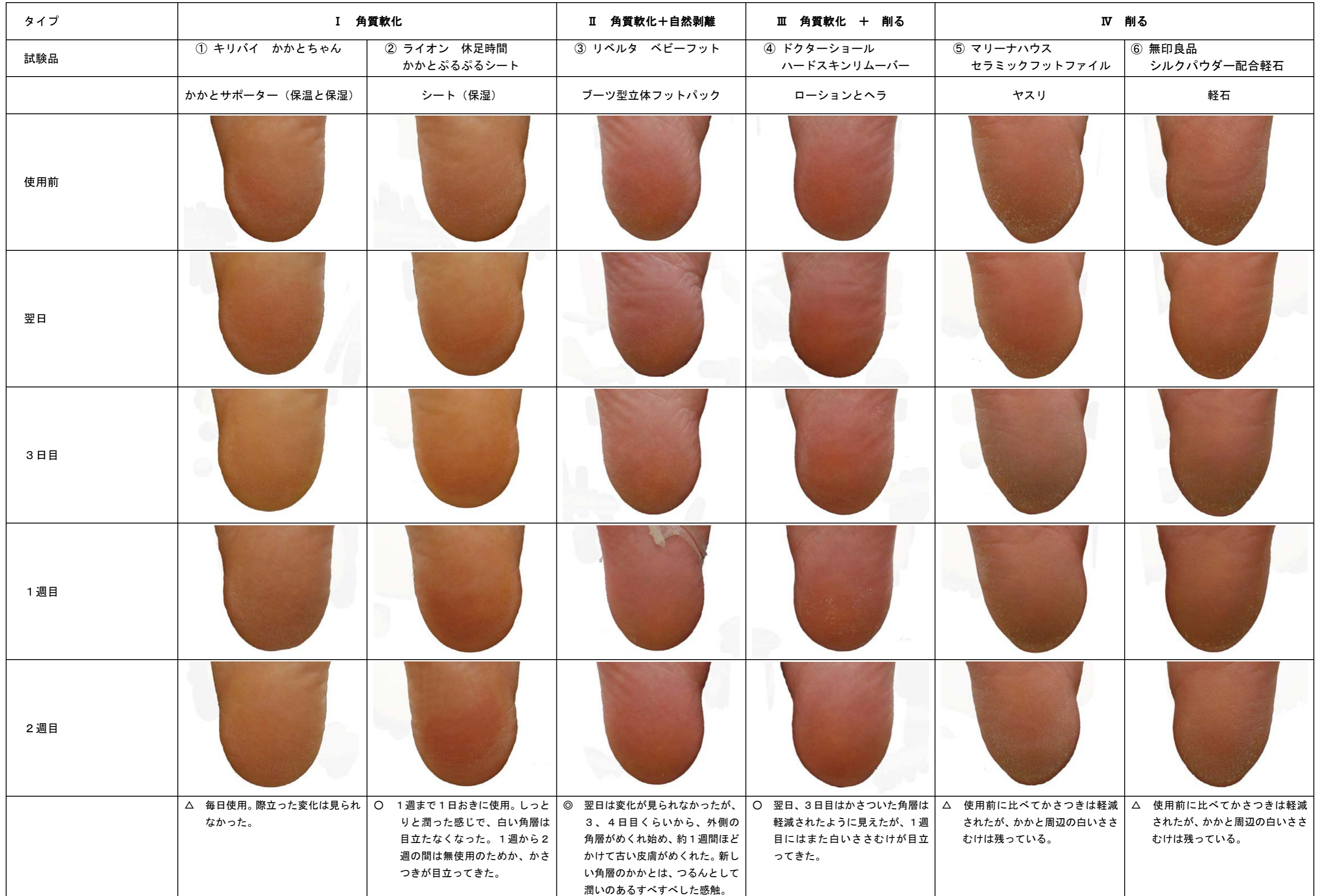
表4 かかと写真 一覧表